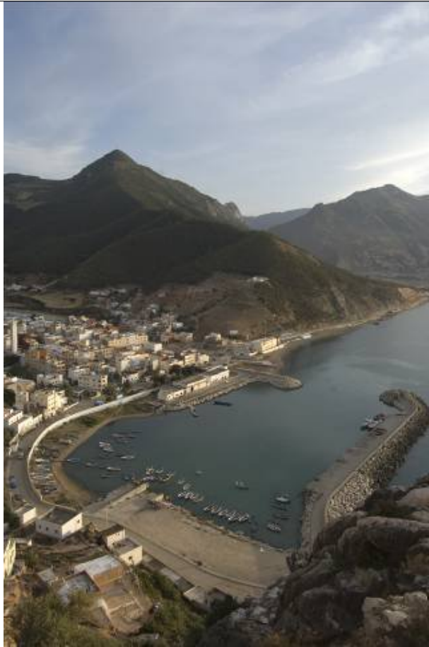
Port de Jebha Illustrant un très beau panorama du Centre de Jebha depuis la mer