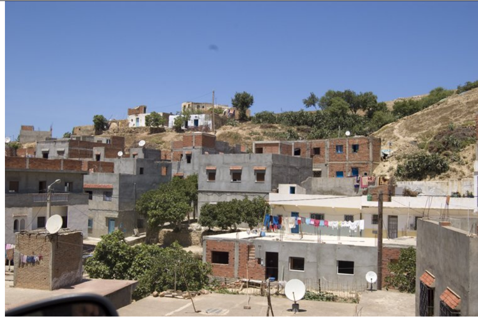
L'autre coté sud du centre de Jebha montre une sous administration urbanistique De même le rejet des eaux usées directement dans le port nuit largement aux atouts touristique et la qualité de vie dans ce centre pourtant assez fréquenté par les touristes