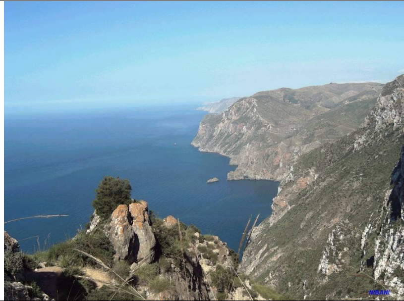
Parc National d'Al Hoceima